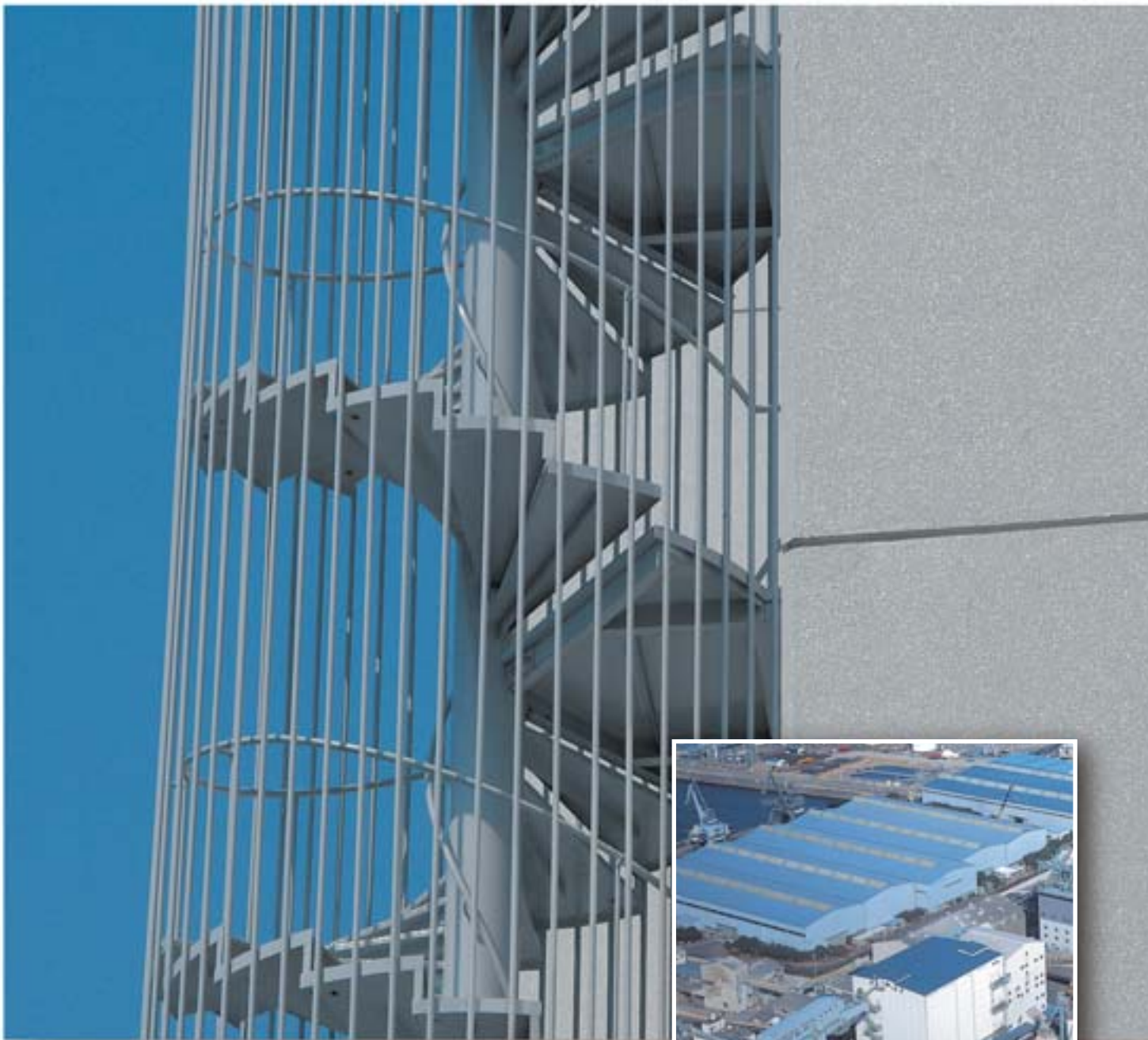
写真はイメージであり、製品とは無関係です。