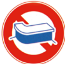
カウンター・床面