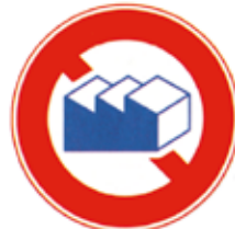
プラント・設備類 (耐油・耐溶剤性必要な場合)