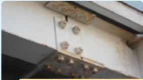
電動工具が入らなく、さびを完全に除去できない部位