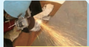
火花や粉塵、騒音等が出せない作業環境でさびを完全に除去できない部位